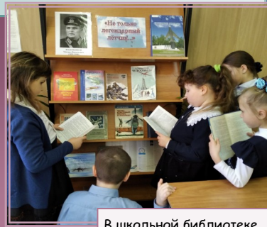
В школьной библиотеке

В библиотеке организована книжная выставка «Не только легендарный лётчик...». На выставке представлены как книги о М. В. Водопьянове, так и издания его произведений. Читательское назначение выставки—учащиеся 3—9 классов. На больших переменах с посетителями библиотеки проводились «Разговоры у книжной выставки», на которых дети знакомились с литературными произведениями М.В. Водопьянова.