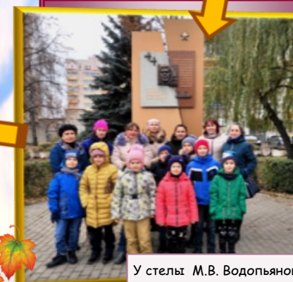
У стелы М.В. Водопьянова