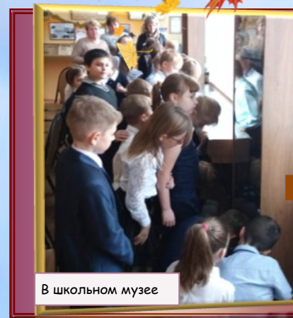
В школьном музее