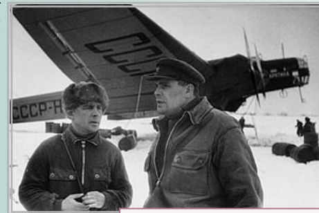
Впервые на Северном полюсе

Я внимательно изучил его биографию, почитал его книги и пришел к выводу, что Водопьянов был человеком исключительной смелости, отваги и доблести, способным на самоотверженные поступки. Он умел действовать в трудных условиях, спас много людей. Именно эти качества и действия сделали его героем, на которого равняются мальчишки, которым восхищаются женщины.