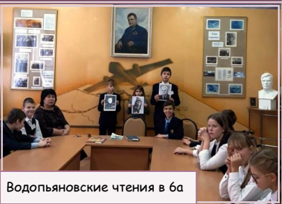
Водопьяновские чтения в 6а