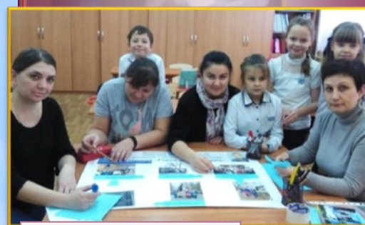
Оформление классного уголка