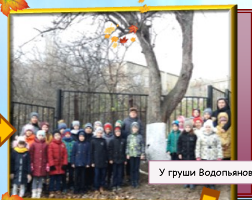
У гроби Водопьянова