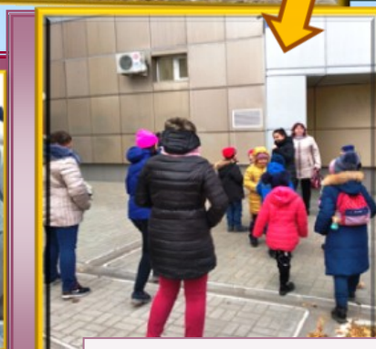
На улице имени М.В. Водопьянова