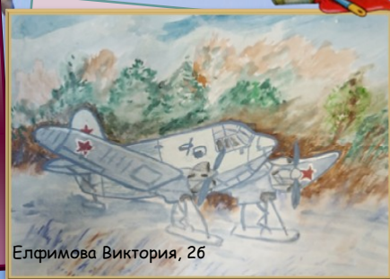
Елфимова Виктория, 2б

Жюри отобрало лучшие работы, которые будут размещены в актовом зале школы.