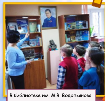
В библиотеке им. М.В. Водопьянова